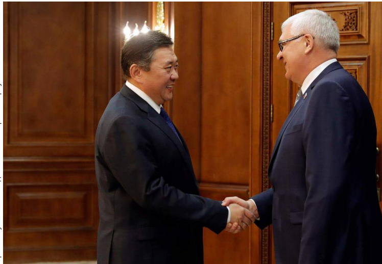
Сергей Брилка и председатель Великого Государственного Хурала Монголии М. Энхболд скрепили договоренности крепким рукопожатием.