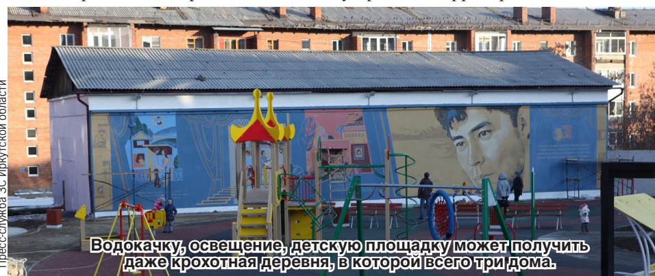
Водокачку, освещение, детскую площадку может получить даже крохотная деревня, в которой всего три дома.

- Именно общественники, активные граждане - наши самые главные помощники для определения приоритетных направлений финансирования, тот мостик между органами власти и населением, который устраняет недопонимание и повышает уровень доверия, - уверен Сергей Брилка.