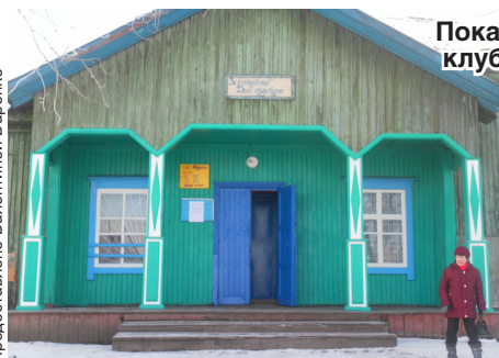
Пока строится новый корпус, клуб временно разместился в здании аптеки.

- Тулун нашел удачное решение по компактному размещению на небольших территориях зон для комфортного отдыха всех жителей города: здесь и детские площадки, и спортивные, и места для отдыха молодежи, - подытожила Ирина Синцова. - Город преобразился, и это очевидно!